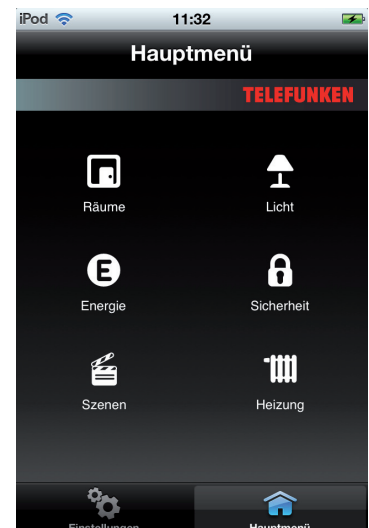
Hauptmenü Joonior iPhone App